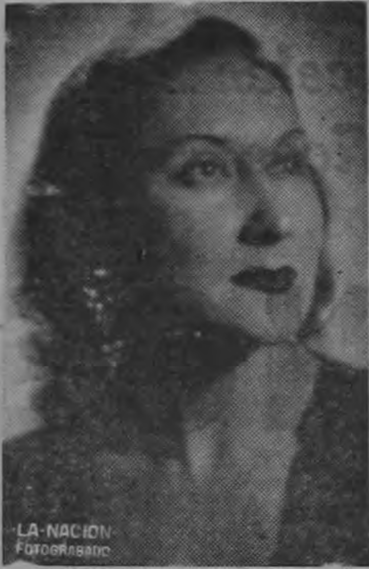
LA NACION FOTOGRAFICO

HOY SABADO A LAS 8.30 P. M. — HORA EXACTA