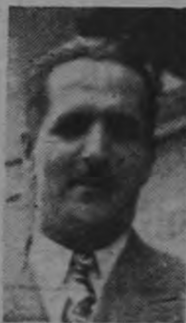
Eladio Trejos Esencia democrática

El precedente senado por el Presidente Abelardo Bonilla en la sesión anterior, surtió notable efecto. Ayer a las tres y treinta de la tarde las 45 curules de la Cámara se encontraban ocupadas y en las barras permanecía a la expectativa un regular número de Supletes, dispuestos a llenar cualquier vacante.