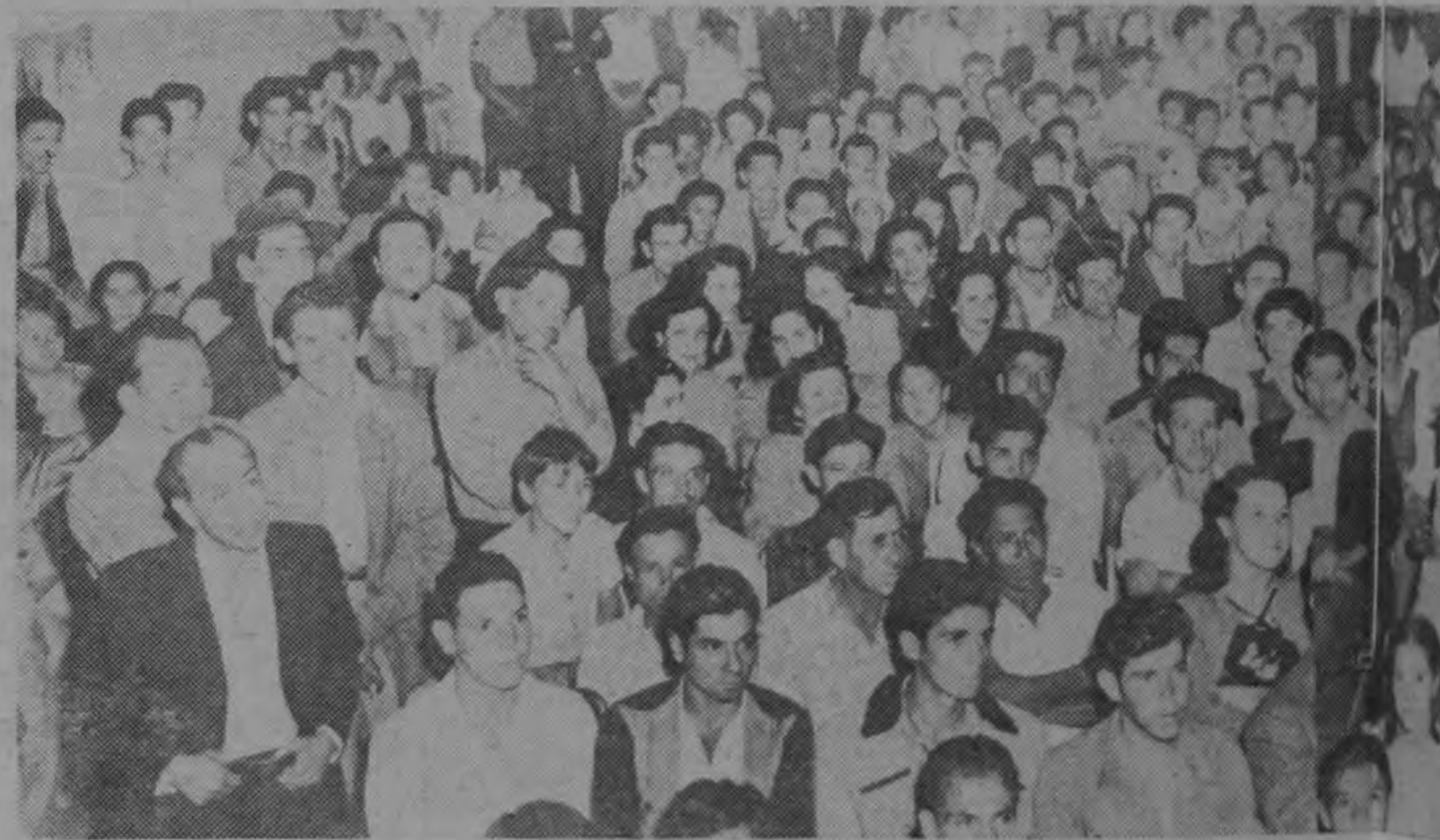
Así, pletórico de entusiasmo, concurrió el pueblo de Curridabat a escuchar al Jefe del Partido Liberación Nacional, don José Figueres, sólo, en tamaño y fervor, cuanto anteriormente había