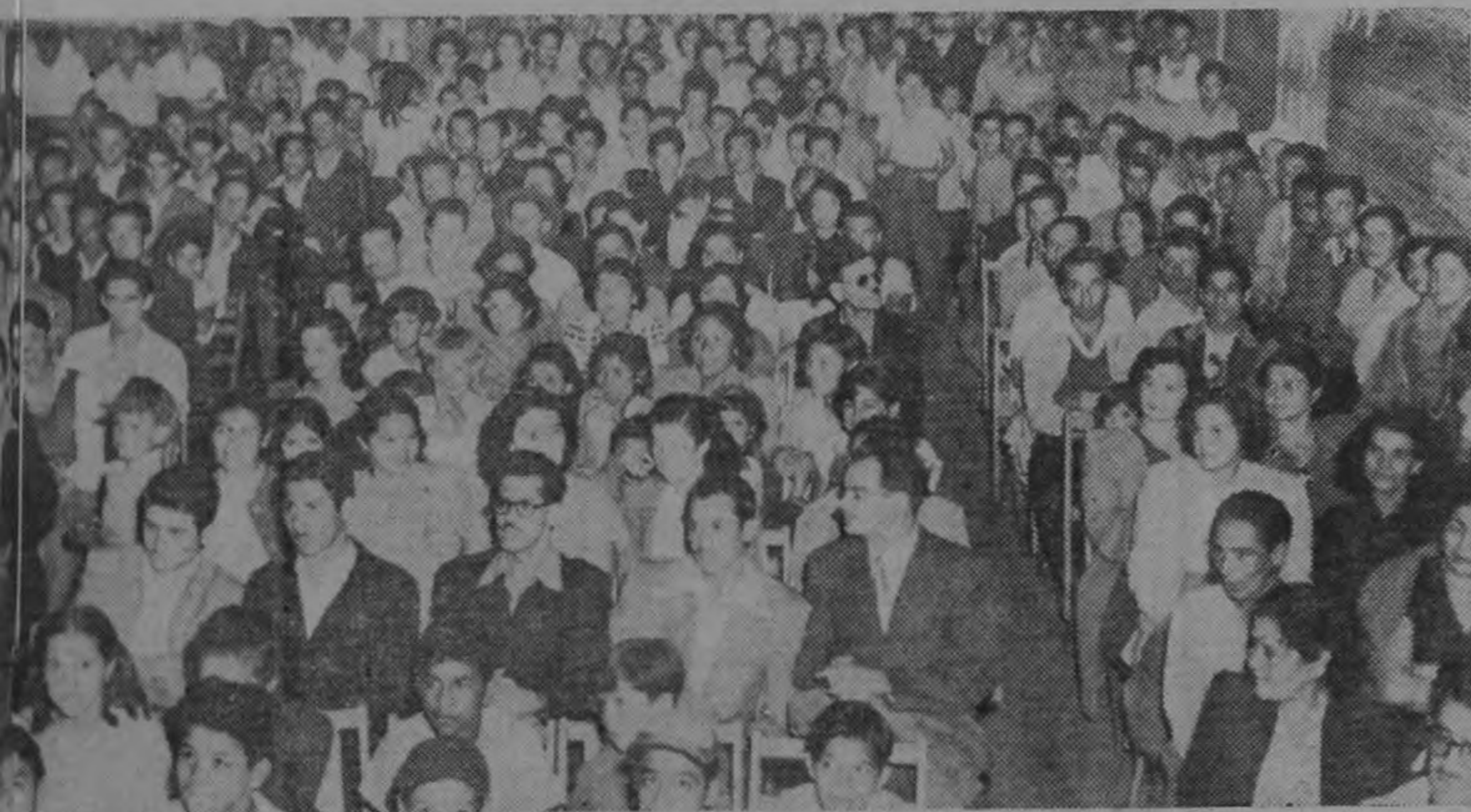
Escuchar la palabra del jefe del Partido Liberación Nacional, en un acto que rebatía había visto esa noble y patriótica población.