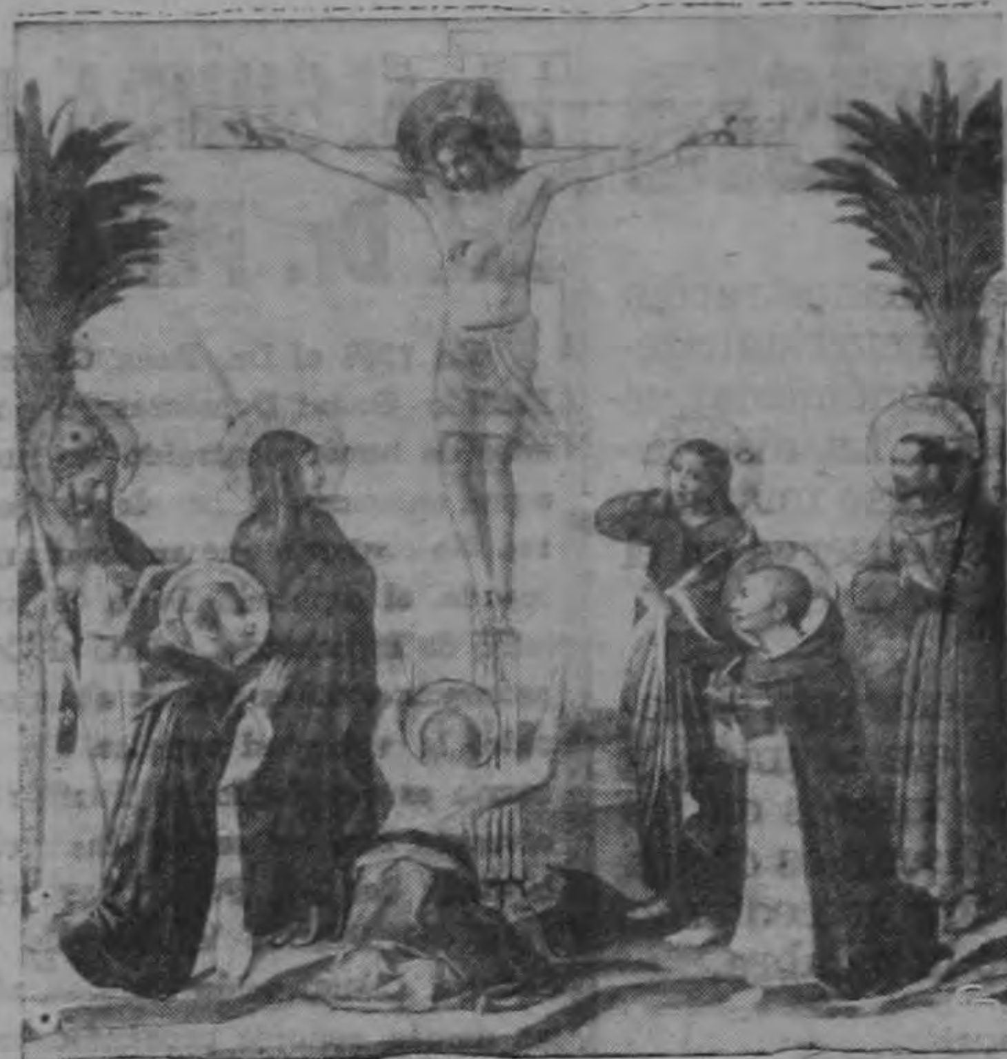
"La Crucifixión". Cuadro de Fra. Giovanne Angelico

Cuando el concilio eclesiástico de Nicea se reunió el año 324 de nuestra Era, para fijar la fecha del Domingo de Resurrección, se decidió que el "Domingo de Pascua" sería siempre el primer domingo después de la luna llena que se presenta en o poco después del 21 de Marzo (entrada de la Primavera); pero si la luna llena aparece en domingo, entonces el de Pascua de Resurrección será el siguiente. Durante más de 100 años se han hecho esfuerzos por dirigentes de la Iglesia y por estadistas también, para convenir en una fecha fija y determinada para la celebración de esa conmemoración. Por dos veces, la Liga de las Naciones, en 1923 y nuevamente en 1928, trató de ponerse de acuerdo en esa fecha. Pero en ambas sesiones, aún cuando no se tomó acción oficial, prácticamente se concluyó que fuera el segundo Domingo de Abril.